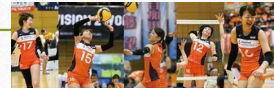
酒田市はプレステージ・インターナショナルアランマーレを応援しています